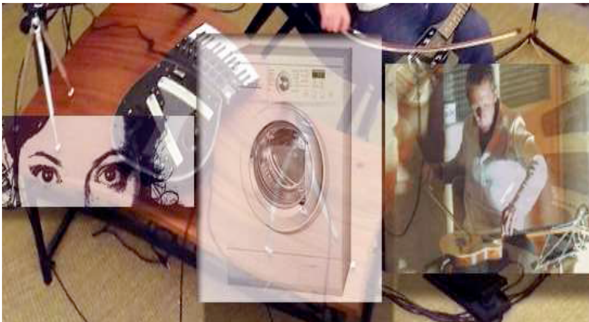
Montage photo Philippe Festou

Machine. 9 questionne le rapport entre l'homme et la machine.