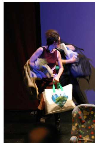
Stéphane Barre ©

Tripes-tics, traite de l'incommunicabilité, de l'accélération du temps, du stress, du quotidien subi. Dans un espace scénique très graphique, les interprètes cohabitent avec un public spatialement rapproché. Les images projetées, les sons, les corps, les objets, les voix s'emballent.