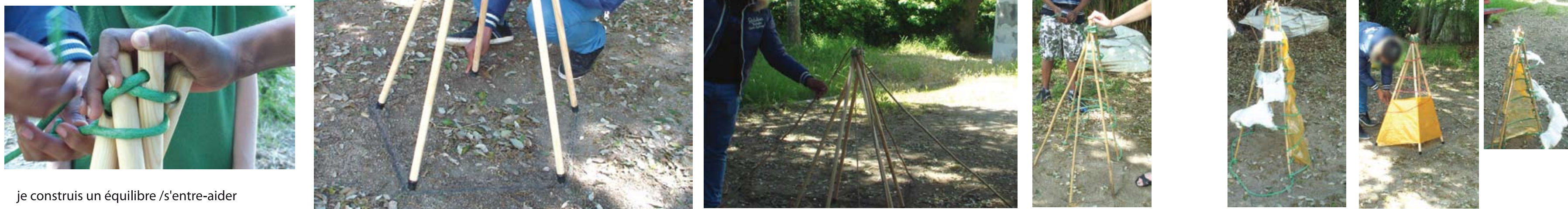
je construis un équilibre /s'entre-aider